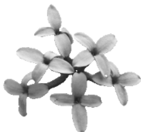
Daphné caméléon

Le vendredi 9 août de 10h à 19h la réserve naturelle régionale d'Aulon organisera son 2ème Festival Nature.