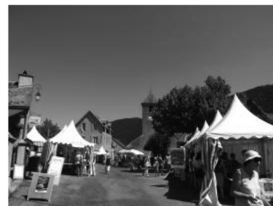
Région : Midi-Pyrénées

Pour tous renseignements complémentaires, vous pouvez contacter la Maison de la nature d'Aulon, tél. 05.62.39.52.34.